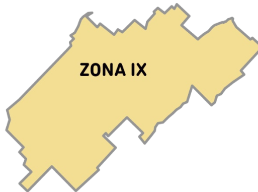
Imagen 2. La Zona IX está conformada por los Partidos: AZUL, GENERAL LAMADRID, LAPRIDA, OLAVARRIA, RAUCH y TAPALQUE.