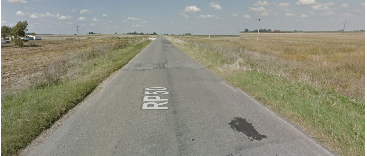
Imagen 4. Deterioro de pavimento flexible en R.P. N° 50, Partido de Rauch.