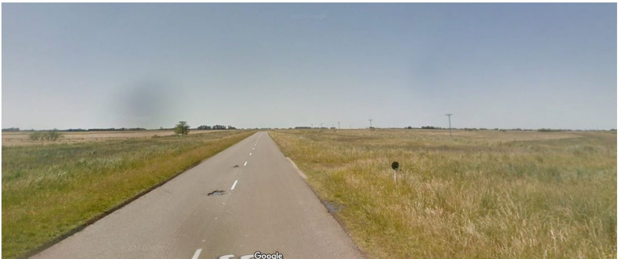
Imagen 3. Deterioro en pavimento flexible en R.P. N° 86, Partido de General Lamadrid.

En las siguientes imágenes se pueden observar el deterioro de los caminos de la red primaria y secundaria de las Rutas de Zona IX.