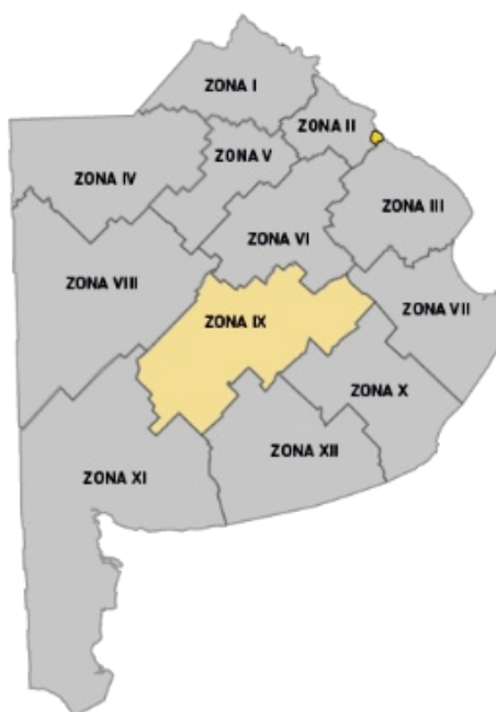
Imagen 1. División de Zonas Viales de la Provincia de Buenos Aires

En las siguientes imágenes se muestra la Zona IX sobre la Provincia de Buenos Aires, la cual será el área a intervenir: